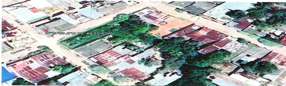
Figura N. º 1. Imagen Google Earth. “Botadero satélite Barrio el Carmen”.

Por medio de OF INT N. º1740, por medio del cual se remite aquella Subdirección para que de acuerdo a sus competencias de cumplimiento al artículo segundo del mencionado acto administrativo.