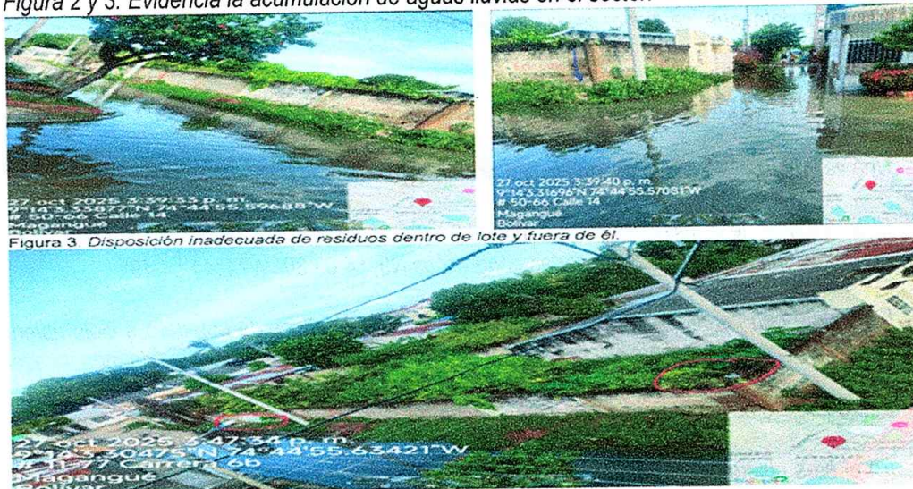
Figura 2 y 3. Evidencia la acumulación de aguas lluvias en el sector.